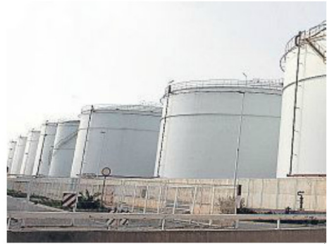
En el 2014, las importaciones chinas crecieron un 9,5%

En el mercado se estima que el plus de importaciones que reali-